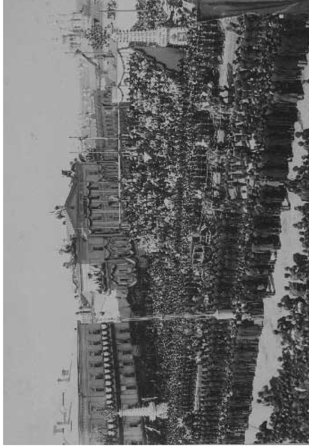
استقبال رسمی از ناصرالدین شاه در سن پترزبورگ روسیه [۲۵۶۶] - [ع]