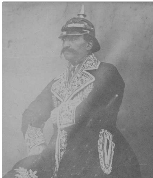
ناصرالدین شاه در لباس نظامیان پروس [ع-۲۵۷۲]

ملتی که ناصرالدین شاه بر آن پادشاهی می‌کند بین تمام ملتهای آسیا معروف و شناخته شده است. ایران در پهنه سیاست به علت رقابت و چشم همچشمی